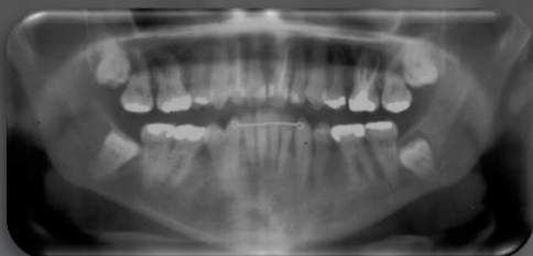
Extração de dentes inclusos

Dentista do Depto de Estomatologia, Saúde Coletiva e Odontologia Legal (FORP)